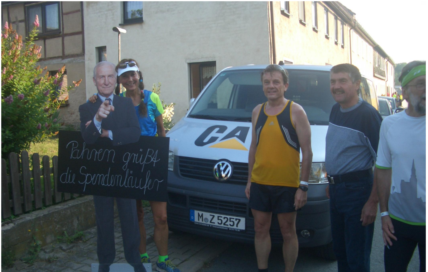
Pahren grüßt die Spendenläufer