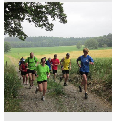
auf der 50km- Strecke