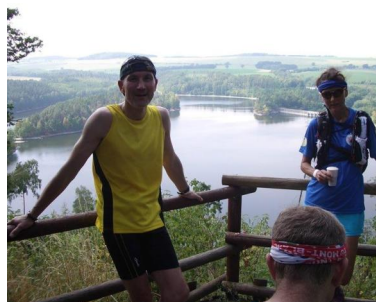
auch Zeit für schöne Blicke