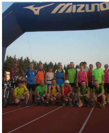
kurz vorm Start