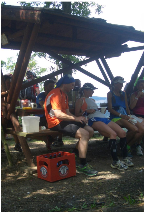
auch Pause muß sein ( erst recht bei der Hitze 36°C)