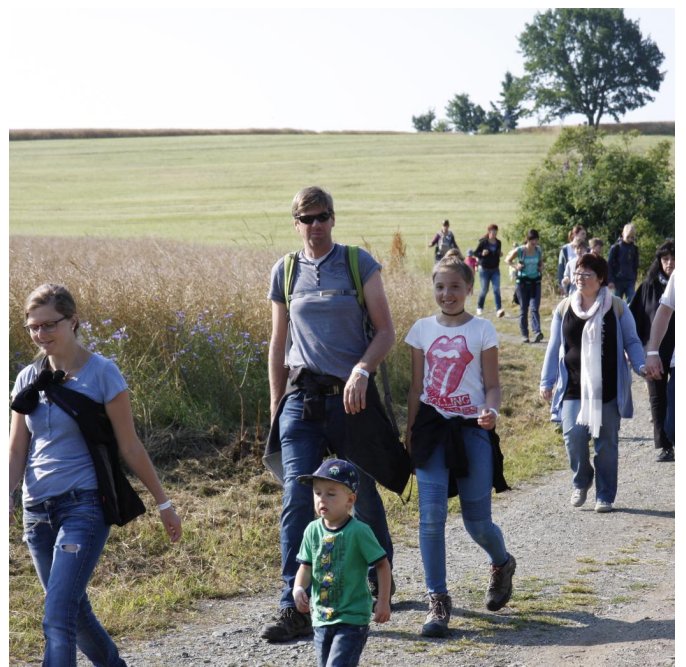
mit der ganzen Familie