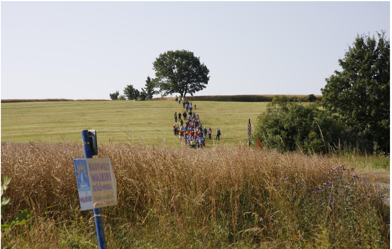
Wandern am Zeulenrodaer Meer